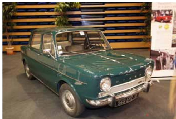
La célèbre Simca 1000 présentée au salon de Paris 1961