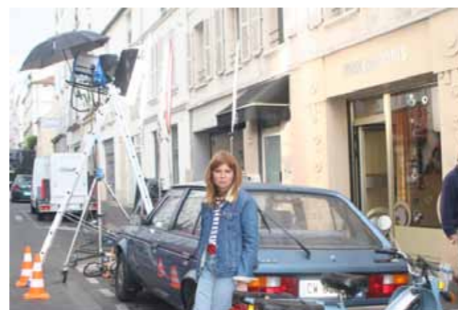
Pour ce tournage, cette jeune actrice a un rôle de figurante.