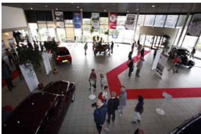
Le hall du Forum Armand Peugeot

texte Jean Le Meaux