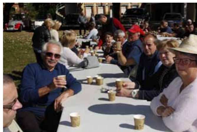
Déjeuner convivial en plein air

A l'heure du déjeuner, nous nous sommes retrouvés à notre point de départ, au parc de la Martinière. Les tables et les bancs ont été dressés par les participants, et nous avons déjeuné dans la joie et la bonne humeur.