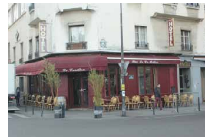
La terrasse de la brasserie «Le Carillon» théâtre du terrible attentat du 13/11/2015.