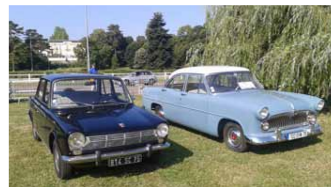
2 véhicules Simca participaient à l'événement : la Versailles de la CAAPY et la 1300 de P. Boulay

Pour accompagner l'augmentation des effectifs de son usine de Poissy, Simca s'est engagée, au milieu des années 1950, auprès de la SCIC (Société centrale immobilière de la Caisse des dépôts et consignations) dans un programme de 730 logements dont 548 lui seront réservés. Les bulldozers ont ainsi pris possession, en février 1956, des 17 hectares du parc du château de Vernouillet.