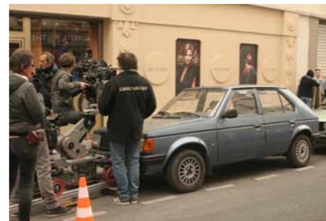
Les deux voitures de la CAAPY stationnées rue Bichat durant les prises de vues