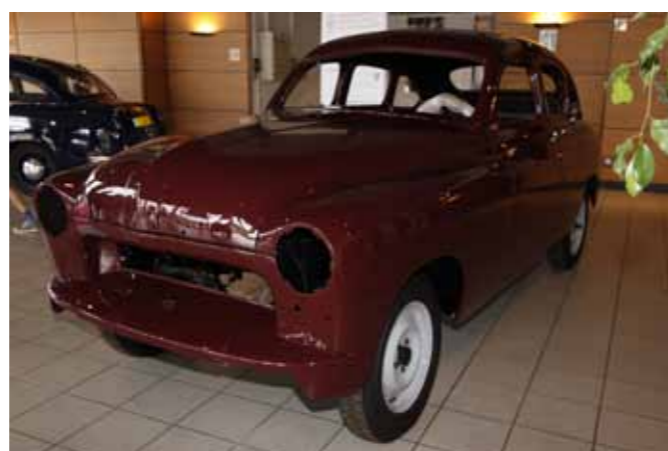
Sa remplaçante, la Ford Vedette dite à dos rond en cours de restauration