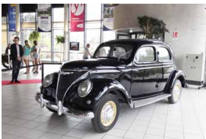
La Ford 472A 1er véhicule particulier fabriqué à Poissy à partir de fin 1946