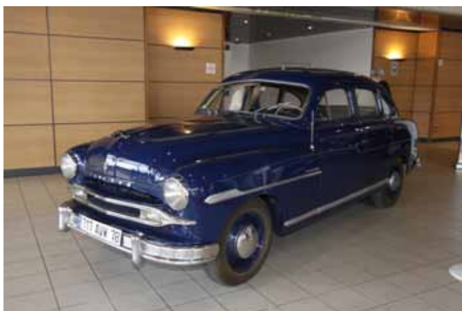
La Ford Vedette tricorps année-modèle 1953