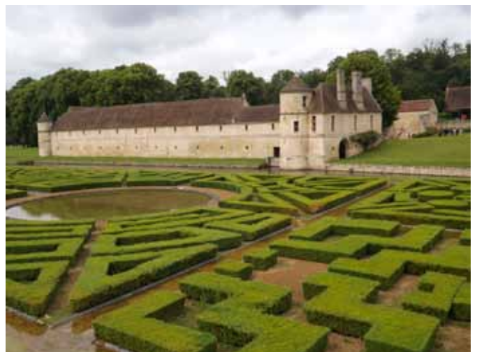
Les jardins et le bassin

les 32 sources recensées sur le site. Le parc constitue, avec son étang de trois hectares particulièrement poissonneux, un refuge pour la faune, avec de nombreux oiseaux (canards, cygnes, hérons cendrés, cormorans...).