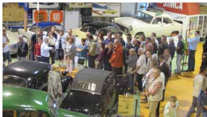
Public nombreux lors des visites guidées