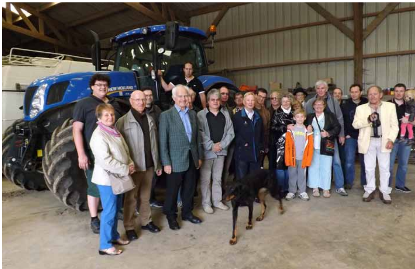
Les participants regroupés dans le hangar de l'exploitation