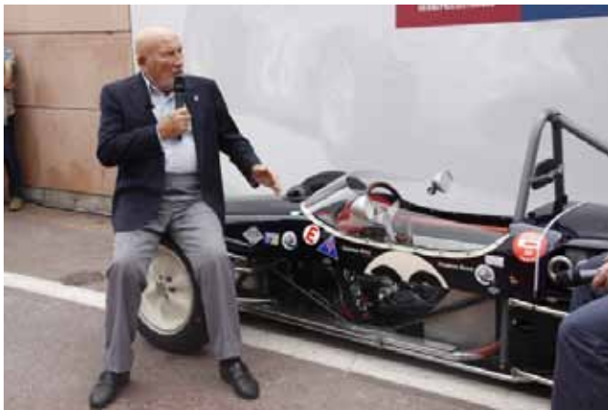
Sir Stirling Moss triple vainqueur à Monaco (1956, 60 et 61) assis sur sa Lotus de 1961.