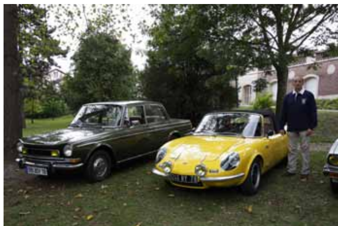
Gilles Dupont à côté de son cabriolet CG

Puis Jean-Claude Bréard, notre maître de cérémonie, a invité, comme de coutume, les propriétaires des voitures les plus remarquables à nous les présenter. Bien souvent, les commentaires ne manquaient pas d'humour !