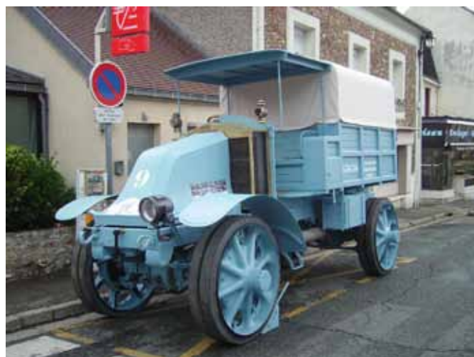
Un Renault EG de 1915 magnifiquement restauré