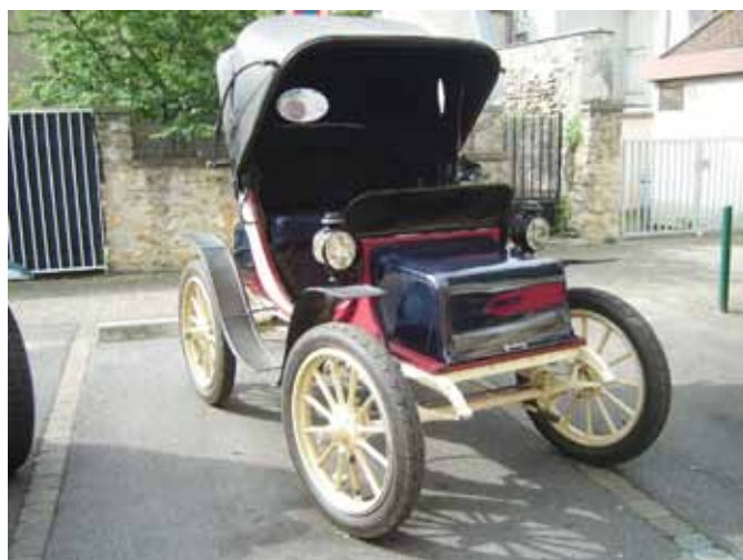
Le véhicule électrique de la Baker Motor Vehicle Company (USA)