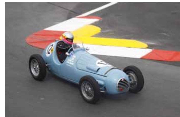
Passages de la Matra MS120B et de la Simca Gordini au S de la piscine