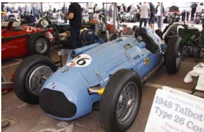
La Talbot-Lago T26C au stand avant la rupture de l'arbre de roue AR dès le 1 er tour