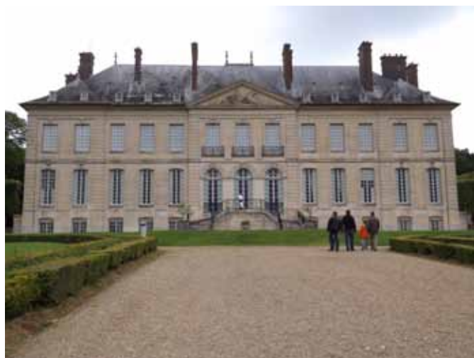
Le chateau dit du haut