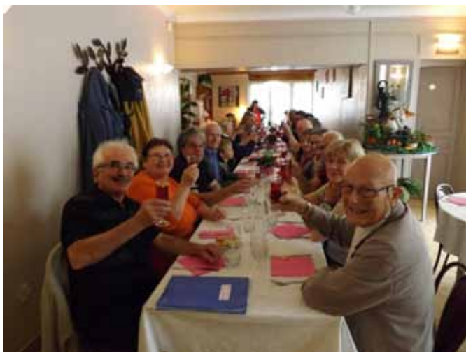
A consommer avec modération !

Retour aux véhicules pour poursuivre la balade touristique qui nous conduit à Magny-en-Vexin pour le déjeuner.