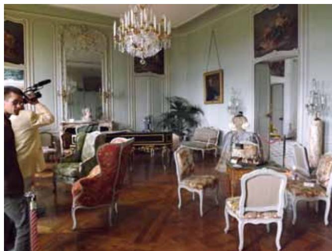
La salle à manger