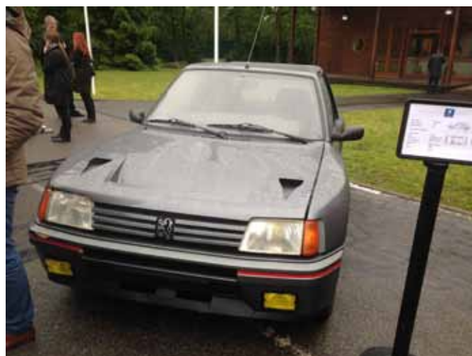
Les 2 véhicules CAAPY mis à la disposition du CERAM pour l'événement