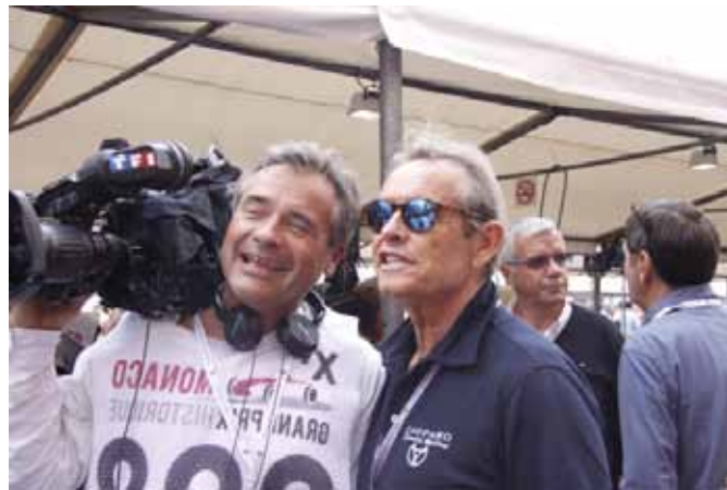
Jacky Ickx avec le cameraman de TF1

Un excellent reportage a été diffusé le dimanche 5 juin 2016. Voici le lien pour le visionner : http://www.tf1.fr/tf1/auto-moto/videos/grand-format-gp-de-monaco-historique-2016-matra-de-beltoise.html?xtor=AD-32