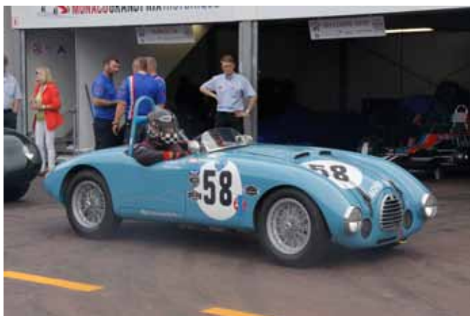
La Simca-Gordini T23S avant la pré-grille