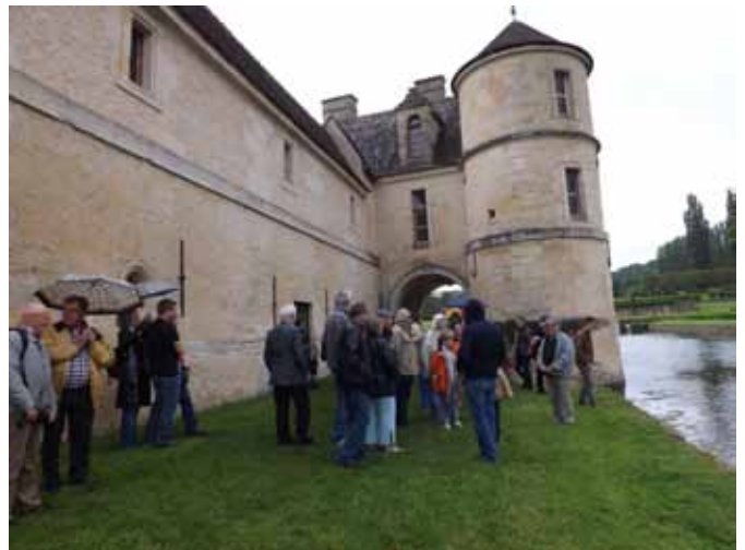
Le Manoir de Ninon

La visite continue avec les jardins suspendus, le bassin d'eau, et au fur et à mesure la découverte se poursuit avec les fontaines et les bassins d'eau, les canaux alimentés par